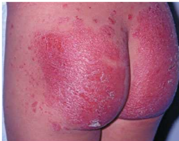
FIGURA 1: Acometimento isolado da região das fraldas

Dermatose é rara na infância e corresponde a cerca de 4% de todas as dermatoses observadas em doentes menores de 16 anos. A apresentação mais comum na primeira infância se caracteriza pelo surgimento de placas eritematosas bem delimitadas envolvendo a genitália e as regiões glúteas e periumbilical, tendendo a ser persistente e rebelde ao tratamento. O acometimento facial não é raro. Com o passar do tempo, novas placas eritematoescamosas tendem a surgir, acometendo, principalmente, o tronco e os membros.